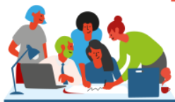
4. Mise en œuvre de l'accompagnement