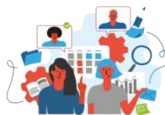
3. Construction du parcours