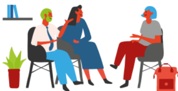
2. Diagnostic partagé